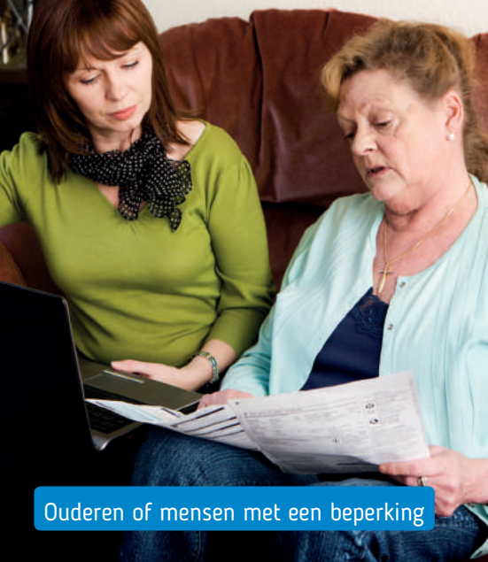
Ouderen of mensen met een beperking