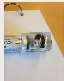
Vergrootglas voor KwikPen