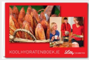
Lilly Diabetes boek gebruikershandleidingen