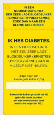
SOS kaart (hypoglykemie)